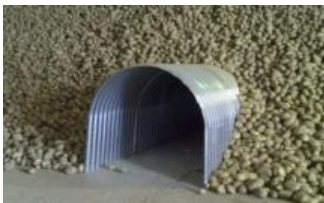
Gaine bords droits

Nos gaines de ventilation, réalisées en tôles ondulées galvanisées vous sont proposées en 2 modèles, standard et à bords droites, et en 2 types, gaines et demi-gaines :